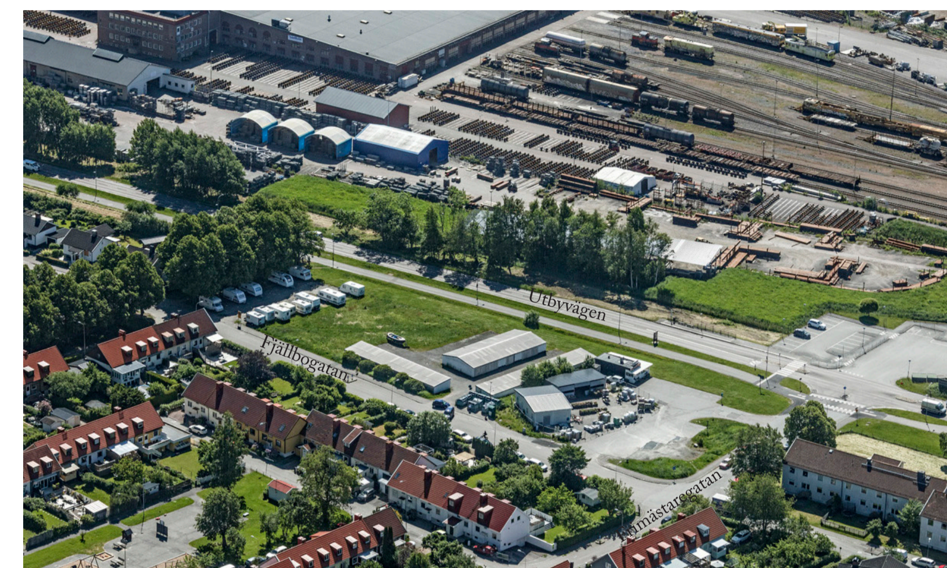
Flygfoto Göteborgs Stad